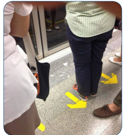
“มนุษย์ป่า” สร้างทางด่วนพิเศษเพื่อแซงคิวขึ้นรถไฟฟ้าใต้ดิน

หากเราต้องการร่วมสร้างสังคมไทยให้น่าอยู่สำหรับคนทุกกลุ่มทุกวัย ต้องเข้าใจว่าการเปลี่ยนแปลงนั้นต้องใช้เวลา กว่าประเทศญี่ปุ่นจะมาถึงจุดนี้ที่คนในชาติมีวินัยและเคารพสิทธิของผู้อื่นได้ ญี่ปุ่นต้องผ่านกระบวนการสร้างสังคมมาอย่างยาวนาน ไม่ได้เกิดขึ้นเพียงชั่วข้ามคืน กระบวนการในการสร้างสังคมนี้สามารถทำได้หลากหลายวิธี เช่น ประเทศจีน ปัจจุบันเกิดคนชนชั้นกลางและเศรษฐีใหม่จำนวนมากที่ไม่รู้มารยาทสังคม จึงมีคอร์สฝึกฝนมารยาทเกิดขึ้นจำนวนมาก เพื่อสอนทักษะการวางตัวในสังคมให้เหมาะสม ตั้งแต่เรื่องการแต่งตัว การรับประทานอาหาร ไปจนกระทั่งการเลือกหัวข้อเพื่อพูดคุยกับผู้อื่นในสังคม ส่วนวิธีใดที่จะเหมาะสมกับประเทศไทยนั้น คงต้องศึกษาและทำความเข้าใจ วัฒนธรรมไทยให้ลึกซึ้ง แต่ตอนนี้ เราเริ่มจากการนิยามเหล่าคุณป่าให้น้อยลงดีกว่าค่ะ