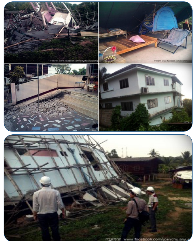
สภาพอาคารบ้านเรือนที่เสียหาย หลังเกิดแผ่นดินไหว จ.เชียงราย

บทบาทสื่อที่เกาะติดสถานการณ์ ทำให้สามารถติดตามข่าวความทุกข์ยากของเพื่อนร่วมชาติได้อย่างต่อเนื่อง เช่น สถานีโทรทัศน์ไทยพีบีเอส ที่เสนอรายการทันต่อสถานการณ์ ทราบความเปลี่ยนแปลงหลายรูปแบบที่เกิดขึ้นในพื้นที่ได้รับผลกระทบ ตลอดจนการเชิญชวนให้สังคมมีส่วนในการบรรเทาความเดือดร้อนของพี่น้องชาวเชียงรายโดยการบริจาคเงิน ความช่วยเหลือ ลักษณะนี้เป็นมาตรฐานสากลที่ควรให้ความร่วมมืออย่างยิ่ง