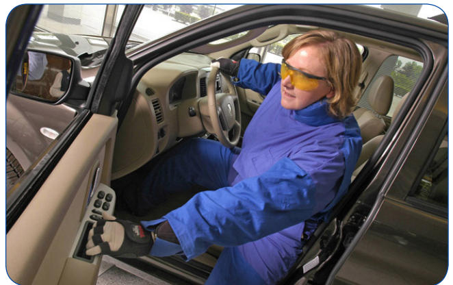
บริษัทฟอร์ด คิดค้นชุดที่สามารถจำลองความรู้สึกของการเป็นผู้สูงอายุให้วิศวกรของบริษัทสวมใส่ เพื่อให้เข้าใจถึงความต้องการของผู้สูงอายุได้ดีขึ้น โดยชุดนี้ทำให้การเคลื่อนไหวเป็นไปได้อย่างยากขึ้น โดยเฉพาะตามข้อต่างๆ และมีแว่นตาที่ทำให้ความสามารถในการมองเห็นลดลง

ทุกวันนี้ ขนาดของประชากรผู้สูงอายุกำลังเพิ่มขึ้นเรื่อยๆ รวมถึงในประเทศไทยเองด้วย และธุรกิจหลายประเภทเริ่มให้ความสนใจกับตลาดผู้สูงอายุมากขึ้น ซึ่งการที่ธุรกิจเริ่มตอบสนองความต้องการของผู้สูงอายุโดยเฉพาะมากขึ้น จะเป็นช่องทางหนึ่งที่ช่วยยกระดับความเป็นอยู่ของผู้สูงอายุในอนาคตให้ดียิ่งขึ้นได้ โดยเฉพาะอย่างยิ่ง หากสังคมหันมาให้ความสนใจคอยสอดส่องดูแลไม่ทิ้งธุรกิจเหล่านี้ หาช่องทางในการเอาเปรียบผู้สูงวัยของเราได้